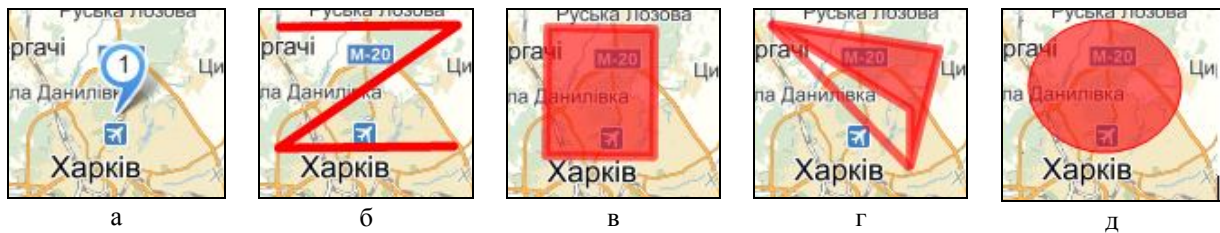
Рис. 1. Географічні об'єкти: а – мітка; б – ламана; в – прямокутник; г – багатокутник; д – коло