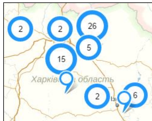
Рис. 3. Групування туристичних об'єктів

ку можна додатково дізнатися «Адресу», «Телефон» та «Короткий опис» цього туристичного об'єкта.