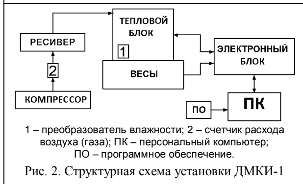
Рис. 2. Структурная схема установки ДМКИ-1

Отдельно расположенный электронный блок отвечает за задание и поддержание температурного режима в рабочей камере и обеспечивает преобразование в цифровую форму и передачу в персональный компьютер (ПК) данных, полученных в ходе эксперимента.