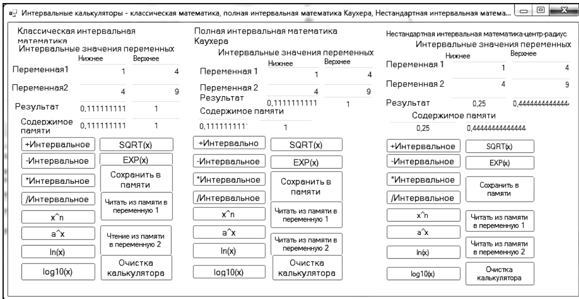
Рис. 2. Окно интервальных калькуляторов с соответствующими полями для введения данных с элементами управления