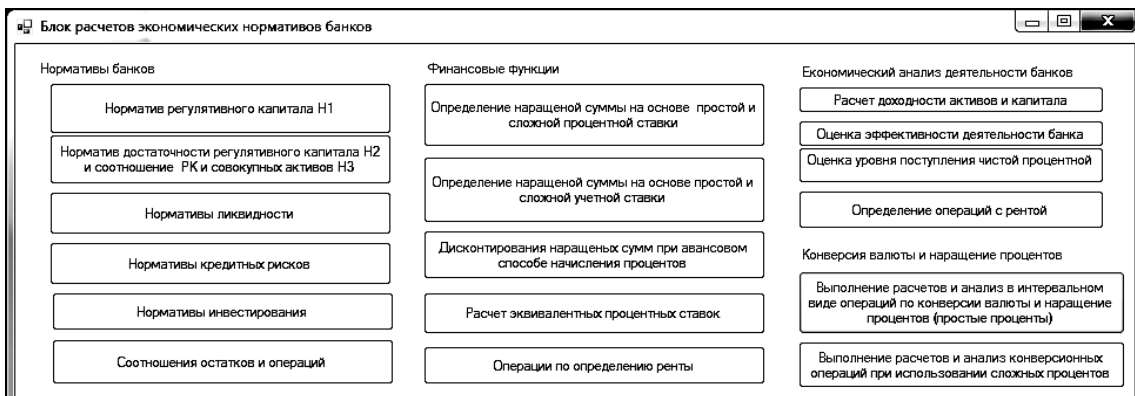
Рис. 3. Окно выбора нормативов банка для расчета