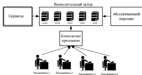
Рис. 2. Упрощенная структура распределенного КП класса А

Пример структуры распределенного КП класса А представлен на рис. 2.