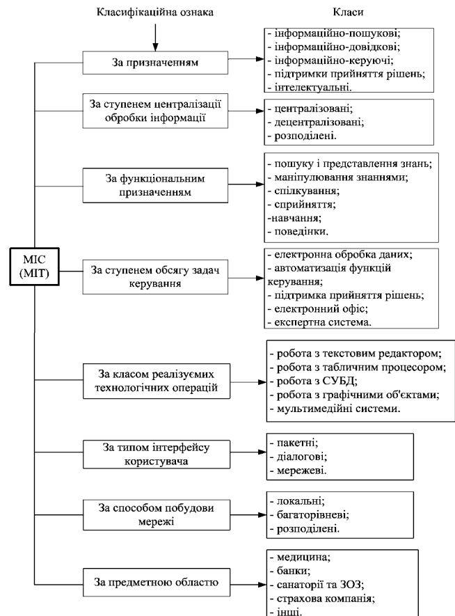
Рис. 1. Узагальнена класифікація МІС (МІТ) [7]

1. Автоматизоване робоче місце базового рівня (АРМБР). Даний клас передбачає такі види АРМів: АРМи лікарів; АРМи головних лікарів; АРМи медпрацівників за профілем діагностичних, лікувальних і реабілітаційних ЗОЗ; АРМи працівників адміністративно-господарських служб і підрозділів [7].