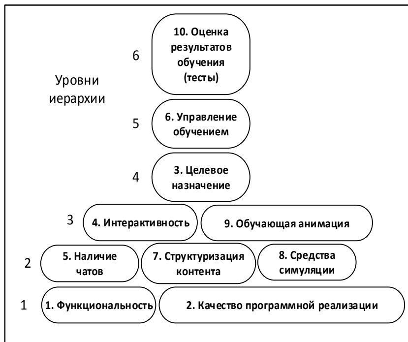
Рис. 2. Иерархическая модель критериев оценивания системы поддержки E-learning

На рис. 2 ПРИВЕДЕН результат построения иерархической модели критериев оценивания системы поддержки E-learning.