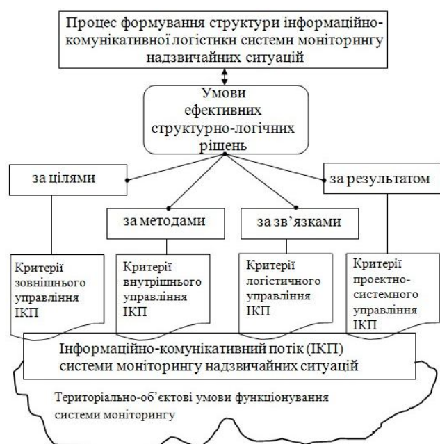
Рис. 1. Формування вимог та структури інформаційної логістики системи моніторингу надзвичайних ситуацій

Попередній аналіз дозволив визначити наступну структурно-логічну схему пошуку рішення поставленої задачі (рис. 1). Визначені групи критеріїв, щодо якісних та кількісних характеристик інформаційно-комунікативного потоку, формують загальне поле інформаційної логістики процесу моніторингу, та потребують у подальшому наступних методів дослідження.