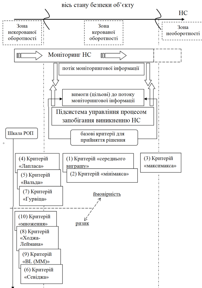
Рис. 3. Класифікації критеріїв прийняття рішення за їх впливом на процеси моніторингу стану безпеки об'єкту контролю

Зауважимо, що раніше висунуте ствердження щодо меж ефективності процесу моніторингу надзвичайних ситуацій, а саме – сенс моніторингу як основи процесу запобігання виникненню надзвичайних ситуацій має місце до її безпосереднього виникнення, потребує уточнення в рамках запропонованих методів [6, 7]. Як видно з наведеного рис. 3, ефективність процесу моніторингу надзвичайних ситуацій визначається межами зони керованої оборотності.