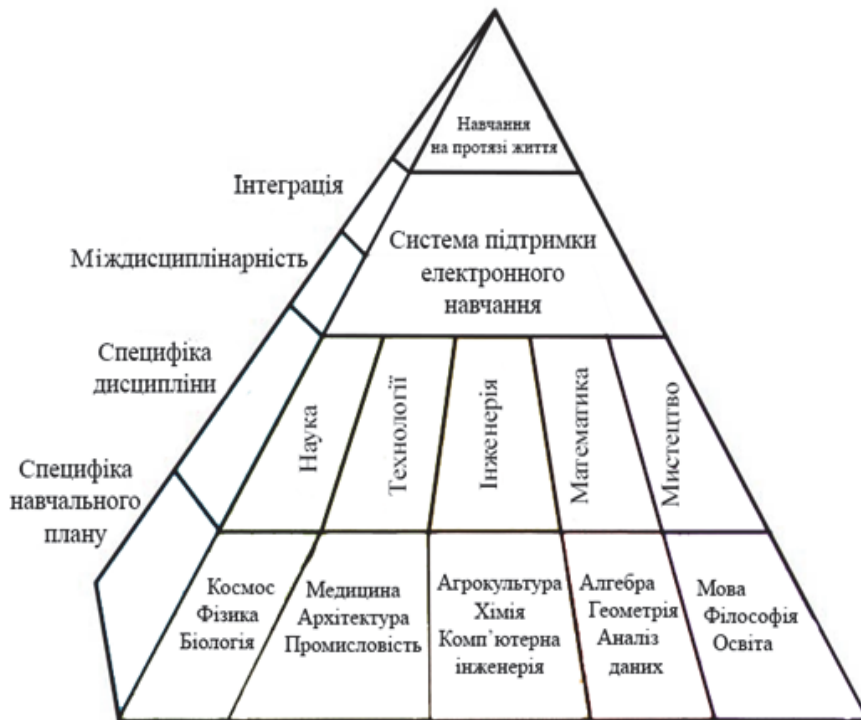
Рис. 1. Схема педагогічної парадигми неперервного навчання на протязі життя

Міждисциплінарний підхід як комплексна методологічна норма дослідницької практики змінює гносеологічну опозицію «суб'єкт–об'єкт» на епістемологічну опозицію «знання–об'єкт».