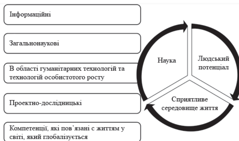
Рис. 2. Схема ключових компетенцій в умовах використання міждисциплінарного підходу

Схема ключових компетенцій, які отримуються студентами в умовах використання міждисциплінарного підходу, наведено на рис. 2.