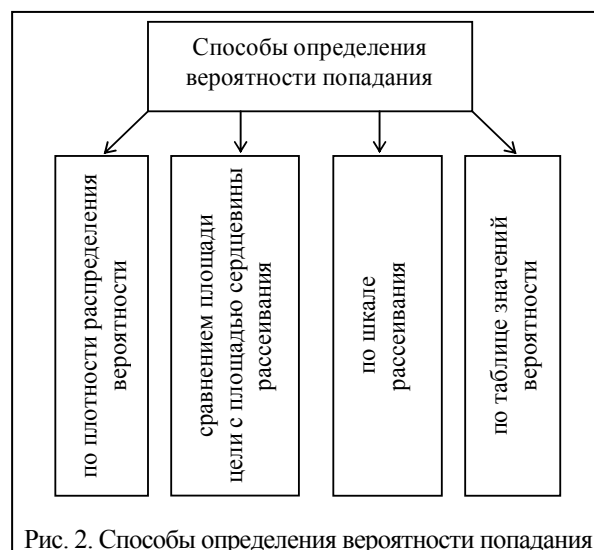
Рис. 2. Способы определения вероятности попадания

Определение вероятности попадания с помощью плотности распределения вероятности [3, 7 – 9]: