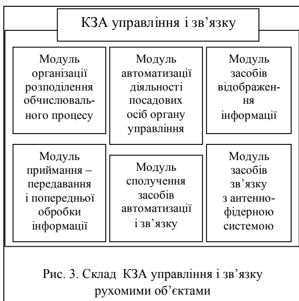
Рис. 3. Склад КЗА управління і зв'язку рухомими об'єктами

Для створення зони покриття радіозв'язку з РО можуть бути використані засоби зв'язку існуючих вузлів зв'язку пунктів управління військових формувань силових структур. Проблемним є визначення оптимальної зони управління R_{3y} при мінімізації затраченого енергетичного ресурсу засобів зв'язку P_{\Sigma} – потужності передавача