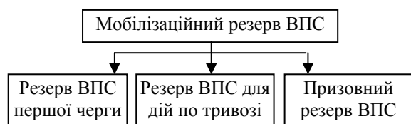
Рис. 4. Структура МР ВПС Німеччини

Комплектування МР ВПС Німеччини ґрунтується на законі про загальну військову повинність. Він включає три компоненти: резерв ВПС першої черги; резерв ВПС для дій по тривозі; призовний резерв (рис. 4).