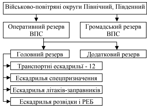
Рис. 3. Структура МР ВПС Франції

Завдання щодо формування і підготовки резерву для ВПС Франції покладено на військово-повітряні округи Північний і Південний. Резерв ВПС Франції включає дві компоненти громадську і оперативну (рис. 3).