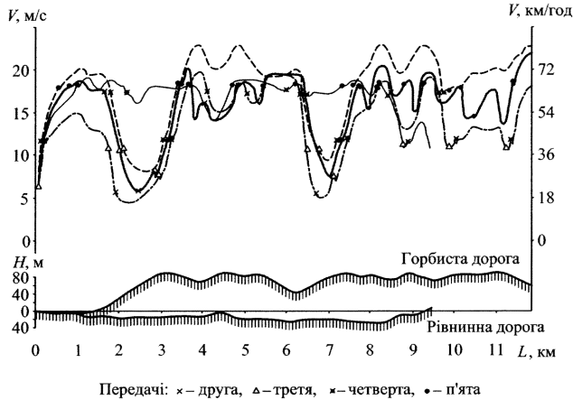
Рис. 1. Графіки зміни швидкості автопоїзда ЗИЛ 130 при різних умовах руху на горбистому і рівнинному маршрутах

Було розраховано графіки математичного сподівання швидкості руху при наявності випадкових перешкод (інтенсивність руху) на маршрутах обох типів.