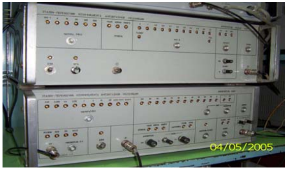
Рис. 4. Зовнішній вигляд ЕП одиниці коефіцієнта амплітудної модуляції

Крім того, на заключній стадії знаходиться розробка військового еталону одиниці напруги змінного струму» (розробляється в межах ДКР шифр «Батуметр») та військового еталону одиниці комплексного опору (розробляється в межах ДКР шифр «Еквілібріст»), які не передбачені ТТЗ на ДКР «Зенкер-93Х», але які можуть бути використані у мобільному комплексі.