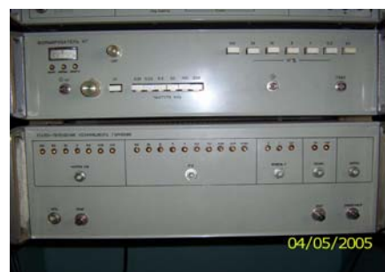
Рис. 3. Зовнішній вигляд ЕП одиниці коефіцієнта гармонік