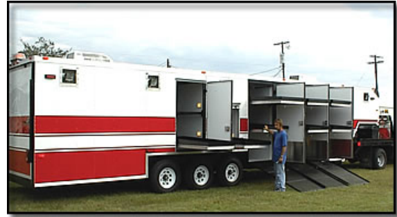
Рис. 11. Спеціалізований трейлер

об'ємом. Вибір контейнеру за принципом максимальної необхідності, «на всякий випадок», економічно недоцільно, так як в умовах невизначеності кінцевих термінів розробки всіх еталонів ми вимушені будемо транспортувати «повітря». Необхідно врахувати також великий розхід дизельного палива тяжких вантажівок типу КРАЗ, КАМАЗ (до 40л/100 км) та підвищені вимоги до кваліфікації водіїв трейлерів (категорії Е).