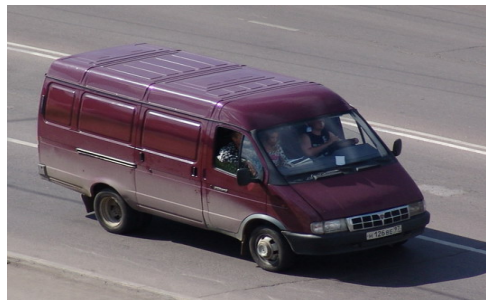
Рис. 7. Вантажні мікроавтобуси «Газель»

При цьому вартість комплексу транспортних засобів оцінювалась (у цінах 1995 р.) у 470000 грн. : залізничний вагон – 374000 грн, мікроавтобуси 16000 \times 6 = 96000 грн.