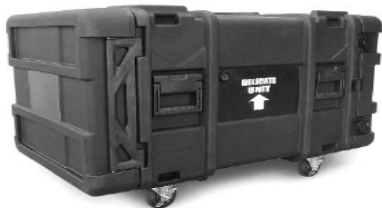
Рис. 15. 19-дюймовий спеціальний контейнер

Наявність у комбінованій схемі, що пропонується, 19-дюймових спеціальних контейнерів (рис. 15), забезпечить можливість доставки окремих еталонів передавання у будь яку точку в межах країни та за її кордонами будь яким видом транспорту у тому числі авіаційним та морським.