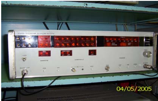
Рис. 5. Зовнішній вигляд ЕП одиниці дев'яти частоти

Крім того, на заключній стадії знаходиться розробка військового еталону одиниці напруги змінного струму» (розробляється в межах ДКР шифр «Батуметр») та військового еталону одиниці комплексного опору (розробляється в межах ДКР шифр «Еквілібріст»), які не передбачені ТТЗ на ДКР «Зенкер-93Х», але які можуть бути використані у мобільному комплексі.