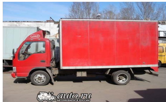
Рис. 12. Вантажний автомобіль типу «JAC»

Таким чином, виходячи з результатів аналізу різних схем транспортування еталонів передавання, найбільш раціональним рішенням транспортної задачі в умовах функціонування Збройних Сил України бачиться використання легких вантажних автомобілів типу «JAC» (рис. 12), «ТАТА» (рис. 13) для транспортування групи еталонів із застосуванням спеціальних контейнерів для оперативного транспортування окремих еталонів за необхідністю надання «термінової метрологічної допомоги» [6] (рис. 14).