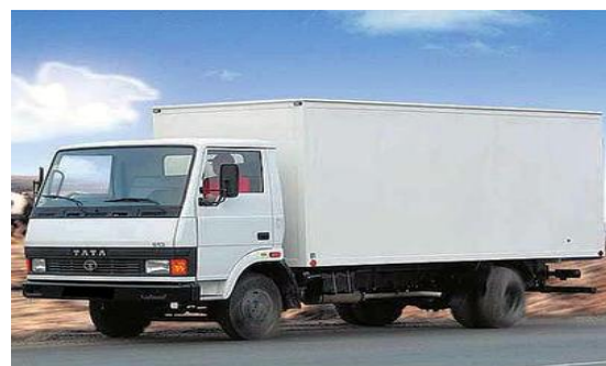
Рис. 13. Вантажний автомобіль типу «ТАТА»