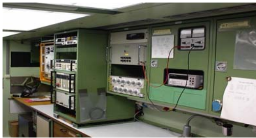
Рис. 9. Вигляд ПЛІВТ армії Бундесфера з середини

Такий варіант порушує обрану у Збройних Силах України стратегію застосування еталонів передавання, яка передбачає використання метрологічної техніки, що є у розпорядженні РМВЧ та необгрунтовано підвищує вартість мобільного комплексу.