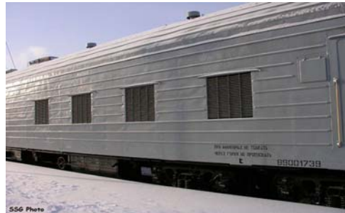
Рис. 6. Залізничний вагон-лабораторія В-60М

побудови метрологічної служби Збройних Сил України [2, 4] (6 регіональних та 3 видові бази вимірювальної техніки) та наявності залізничної лабораторії (залізничного вагону) у штаті в/ч А0785.