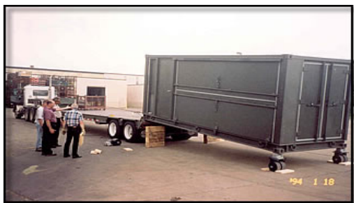
Рис. 10. Вантажний контейнер

Іншим варіантом, що застосовується у збройних силах США є транспортування військових еталонів у стандартних вантажних контейнерах (рис. 10), у спеціалізованих трейлерах (рис. 11).