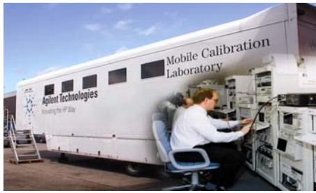
Рис. 8. ПЛІВТ армії Бундесфера

вимірювальної техніки (ПЛІВТ) (рис. 8). На базі робочих еталонів повністю розгорнути робочі місця (рис. 9).