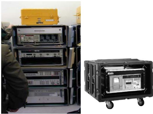
Рис. 14. Спеціальні контейнери для оперативного транспортування

Вартість автомобілів типу «ЯС», «ТАТА» складає біля 60000 грн, розхід дизельного палива – 10л/100км, потрібна кваліфікація водіїв – категорія Б.