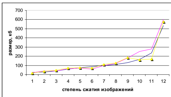
Рис. 2. Результати роботи алгоритму PSNR

Нагадаємо, що, як і всі існуючі метрики, PSNR не ідеальна й має свої достоїнства й недоліки. У результаті роботи алгоритму PSNR і запропонованого алгоритму отримані наступні результати (рис. 2).