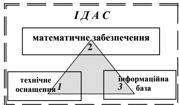
Рис. 1. Структурна схема інформаційно-довідкової автоматизованої системи

Згідно визначення, наданого в [1] ІДАС – система автоматизованої реєстрації, переробки, збереження і видачі інформації, що призначена для забезпечення абонентів відомостями довідкового характеру. Типова ІДАС складається з 3-х основних частин: технічного оснащення, математичного забезпечення і інформаційної бази. На основі визначення розроблено структурну схему ІДАС (рис. 1).