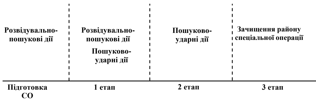
Рис. 1. Перелік пріоритетних способів дій силових відомств держави у період підготовки та проведення СО

Перелік пріоритетних способів дій силових відомств держави у період підготовки та проведення зазначеної СО проілюстрований на рис. 1. На етапі підготовки операції ці дії можуть характеризуватись як розвідувально-пошукові, з тлумаченням складової «пошукові» у розумінні «виявлення» об'єктів розвідки, тобто визначення їх наявності або відсутності у заданому районі. Така інформація може бути отримана, наприклад, за допомогою комерційних супутників «відкритого борту», засобів авіаційної розвідки (в тому числі безпілотних), а також завдяки агентурній розвідці і оперативно-розшуковій діяльності певних силових відомств держави. На першому етапі періоду проведення операції розвідувально-пошукові дії продовжуються, але складова «пошукові» на цьому етапі має тлумачитись, і як спосіб ведення військової розвідки розвідувальними органами силових відомств, і як спосіб дій притаманним внутрішнім військам.