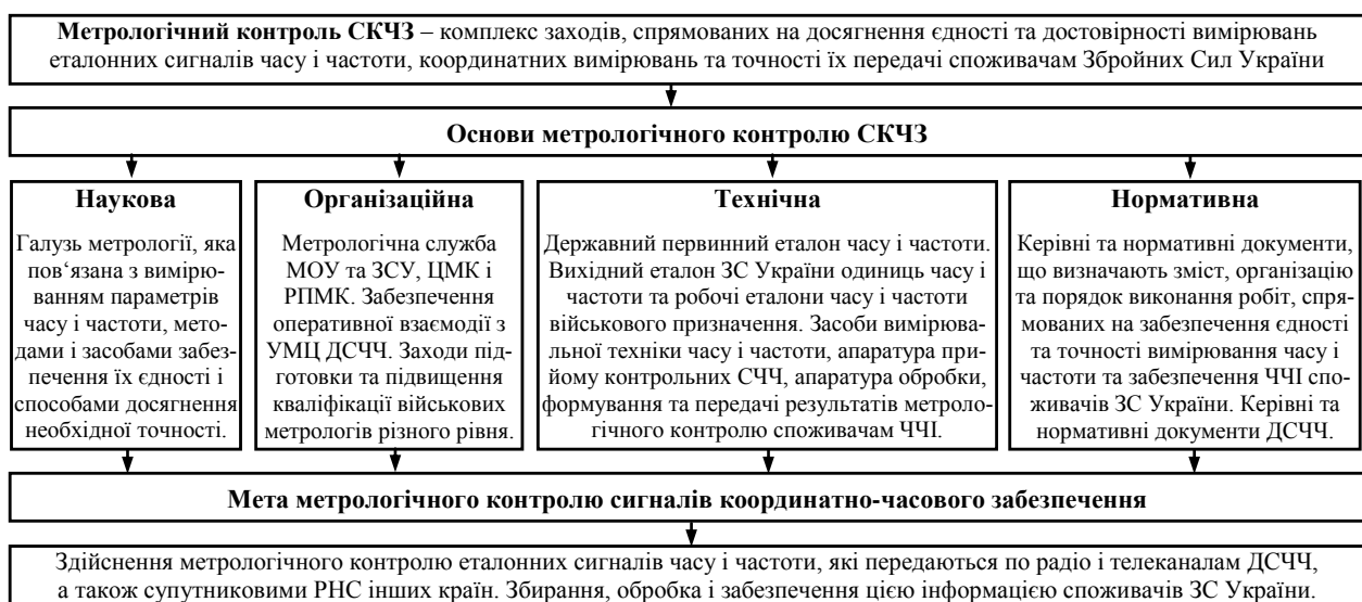
Рис. 1. Основи метрологічного контролю СКЧЗ

У найближчій перспективі передбачено чинним порядком розробити науково-методичний апарат повірки із оцінюванням невизначеності вимірювань для засобів вимірювальної техніки військового призначення (ЗВТВП), які використовуються миротворчими контингентами [6]. Планується також розробити науково-методичний апарат оцінювання невизначеності вимірювань для ЗВТВП, які найбільш поширені та розповсюджені у ЗС України. Даний захід можливо здійснити тільки із залученням організацій Державного комітету України з питань технічного регулювання та споживчої політики, науково-дослідних закладів України та розробників військової вимірювальної техніки.