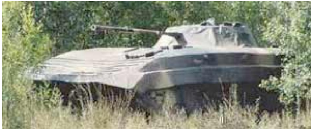
Рис. 4. Вигляд макету БМП-2, що пропонується фірмою "Росвооружение"

Існує багато виробників, що пропонують різноманітні конструкції макетів. Наприклад, "Росвооружение" пропонує пневматичний макет бойової машини БМП-2 (рис. 4).