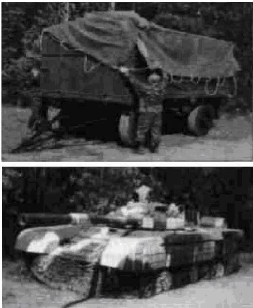
Рис. 3. Імітаційний макет танку Т-72 розробки "Минотор-сервис"

Для імітування танка типу Т-72 виробником "Минотор-сервис" запропоновано окремий виріб (рис. 3), який здійснює імітацію танка в оптичному, тепловому і радіолокаційні діапазоні. У транспортному положенні виріб зовні не відрізняється від стандартного автомобільного причепа-фургона, та має вагу 3,5 т. Макет має деформуюче фарбування і пристрій теплової імітації.