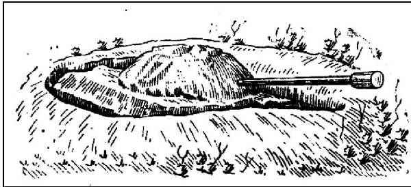
Рис. 1. Макет танка із ґрунту у хибному окопі [1]

підготовки оборони, в хибних районах і на позиціях цей підрозділ може влаштовувати макети з ґрунту (рис. 1) або снігу [1]. На облаштування макету потрібно витратити 30...35 чол.-год, при цьому макет здійснюватиме відображення танку лише у видимому діапазоні. Це дозволяє сучасним засобам розвідки з високої ймовірністю виявити хибну мішень. Сучасними засобами маскуванню техніки у інфрачервоному та радіохвильовому діапазонах цей підрозділ не забезпечений. Тому, маскуванню можливо лише з використанням наявної рослинності або ґрунту, що є низько ефективним та малопродуктивним.