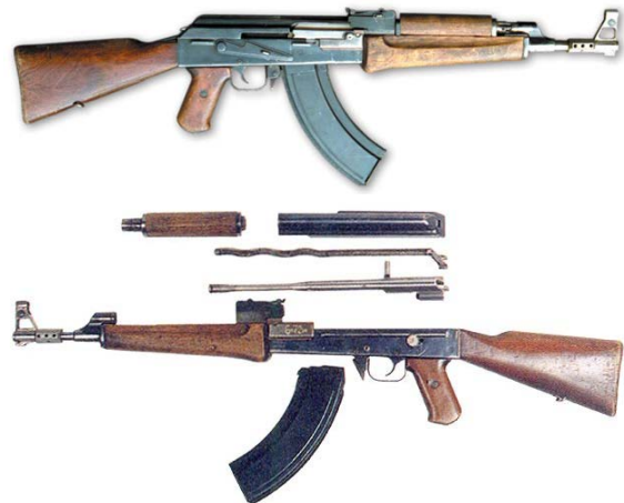
Рис. 6. Перший зразок дослідницького 7,62-мм автомата Калашникова (АК-47) і його неповне розбирання