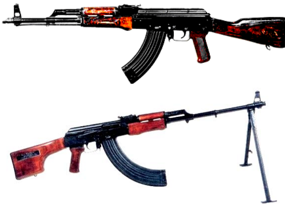
Рис. 8. 7,62-мм модернізований автомат Калашникова (АКМ) з дуловим компенсатором та 7,62-мм ручний кулемет Калашникова (РКК)

З цієї миті почався всесвітньо відомий марш зброї системи Калашникова. 1 вересня 1949 року Калашников М.Т. був зарахований до штату відділу головного конструктора "Іжмаша" і пройшов шлях від рядового конструктора до Головного конструктора стрілецької зброї, від старшого сержанта до генерал-лейтенанта. У 1958 році М.Т. Калашникову за модернізований 7,62-мм автомат АКМ і створений на його базі ручний кулемет РКК (рис. 8) було при власнено звання Героя Соціалістичної Праці. Конструкція АКМ доповнена дуловим компенсатором і міжцикловим сповільнювачем, які підвищили купчастість стрільби; змінений зовнішній вигляд багнет-ножа; з'явилися нові навісні прицільні пристрої для нічної стрільби, тощо.