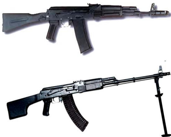
Рис. 12. 5,45-мм автомат АК74М (5,56-мм АК101; 7,62-мм АК103) та 5,45-мм ручний кулемет РКК74М

Із 1991 року почався випуск модернізованого варіанту 5,45-мм автомата АК74М та його модифікацій АК74МП і АК74МН (з оптичним і нічним прицілом) і ручного кулемета РКК74М (рис. 12). У конструкцію АК74М втілена ідея “універсального” автомата що замінив відразу чотири моделі – АК74, АК74Н, АКС74, АКС74Н. Головна новинка цього зразка – міцний пластмасовий приклад, що складається, стандартний вузол (планка “ластівчин хвіст”) для кріплення нічних і оптичних прицілів, новий двокамерний дуловий гальмо-компенсатор з однаковими камерами, посилена також кришка ствольної коробки, зручнішими стали цівка і ствольна накладка. Всі автомати мають місця для кріплення підствольного гранатомета і приладу для безшумної стрільби.