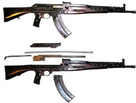
Рис. 5. Дослідницький 7,62-мм автомат Булкина (АБ-46) і його неповне розбирання

Автомат задовольнив всім вимогам програми випробувань, і комісія склала звіт: “Рекомендувати 7,62-мм автомат конструкції старшого сержанта Калашникова, під назвою АК-47, для ухвалення на озброєння Радянської Армії” (рис. 7).