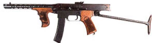
Рис. 1. Пістолет-кулемет (ПКК-42), виготовлений у МАІ

Молодого винахідника Калашникова прийняв перший секретар компартії Казахстану Кайшигулов і направив із зразком пістолета-кулемета в Московський авіаційний інститут ім. С. Орджонікідзе, евакуйований до Алма-Ати, де в майстерні факультету стрілецько-гарматного озброєння авіації виготовили другий більш досконалий зразок (рис. 1).