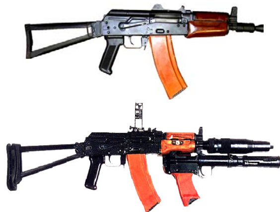
Рис. 11. 5,45-мм укорочені автомати АКС74У та АКС74УБ (із приладом безшумної стрільби (ПБС) і безшумним підствольним гранатометом БС-1)