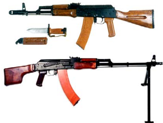
Рис. 10. 5,45-мм автомат Калашникова (АК74) та 5,45-мм ручний кулемет Калашникова (РПК74)

Військові випробування завершилися прийняттям на озброєння у 1974 році (Ухвала ЦК КПРС і СМ СРСР від 18.03.1974 р. № 049) 5,45-мм автомата АК74 і ручного кулемета РКК74 (рис. 10). Трохи пізніше приймаються розроблені на їх базі – АК74Н, АКС74, АКС74Н і ручні кулемети – РКК74Н, РККС74, РККС74Н, а також укорочені варіанти АКС74У, АКС74УН, АКС74УБ (рис. 11).