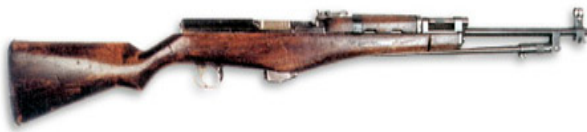
Рис. 2. 7,62-мм самозарядний карабін Калашникова (СКК-44) під патрон зразка 1943 року

Наприкінці 1942 року командування Середньо-азіатського військового округу направляє старшого сержанта М.Т. Калашникова у конструкторське бюро на Центральний науково-дослідний полігон стрілецько-мінометного озброєння (НПСМВО) Головного Артилерійського управління РККА в місто Коломну. Тут він продовжує роботу над удосконаленням пістолета-кулемета, а також конструює ручний кулемет і самозарядний карабін СКК-44 (рис. 2). Хоча ці зразки путівки в життя не отримали, проте вони стали гарною конструктивною базою для створення легендарного автомата АК-47.