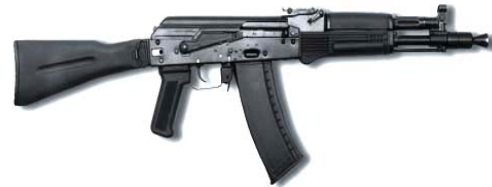
Рис. 13. 5,45-мм укорочений автомат АК105 (5,56-мм АК102, 7,62-мм АК104)

XXI ст., призначені також і для продажу на міжнародних ринках. Вони випускаються у трьох “автоматних калібрах”: АК101 (АК102 – укорочена модель) – під патрон 5,56×45-мм НАТО; АК103 (АК104 – укорочена модель) – під патрон зразка 1943 року 7,62×39-мм, що добре себе зарекомендував і відомий у різних країнах; та АК105 – укорочена модель під патрон 5,45×39-мм (рис. 13).