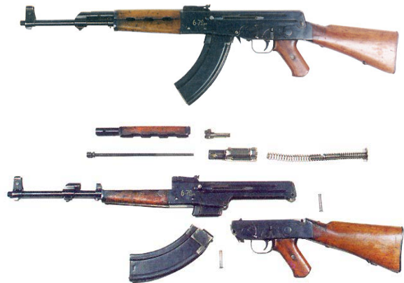
Рис. 3. Дослідницький 7,62-мм автомат АК-46 і його неповне розбирання

лення надало йому розуміння, як НЕ ТРЕБА конструювати автомат.