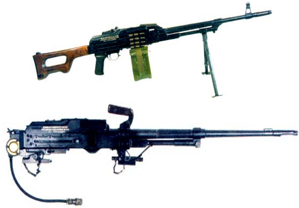
Рис. 9. 7,62-мм модернізований кулемет ККМ та 7,62-мм модернізований кулемет Калашникова танковий (ККМТ)

пробування були допущені зразки Калашникова і Константинова (м. Ковров).