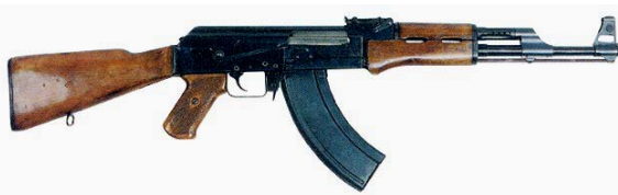
Рис. 7. Серійний автомат Калашникова (АК-47)

У 1948 році за розпорядженням Головного маршала артилерії Н.Н. Воронова Михайло Тимофійович Калашников прямує на Іжевський машинобудівний завод для створення технічної документації і виготовлення 1500 автоматів для всебічних військово-експлуатаційних випробувань. До 20 травня 1949 року військові випробування були успішно завершені. Перевірка автоматів у військах показала, що АК-47 – саме та індивідуальна зброя, яка потрібна солдатам.