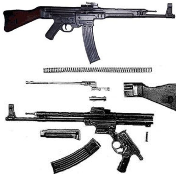
Рис. 4. Автомат штурмгевер StG-44 і його неповне розбирання

При порівнянні видно, що “калш” більш компактний ніж штурмгевер. Ствольна коробка його коротша і закінчується відразу за пістолетною рукояткою, тобто ударно-спусковий механізм більш компактний. Крім того у штурмгевера більший хід затвора і довша зворотно-бойова пружина, яка впирається у приклад і не має напрямного стрижня. А саме головне, що відрізняє ці автомати – це замикання каналу ствола, у StG воно здійснюється вертикальним переміщенням затвора майже на 5 міліметрів, а у АК рухом затвора вперед і поворотом його по годинниковій стрілці (глухе замикання).