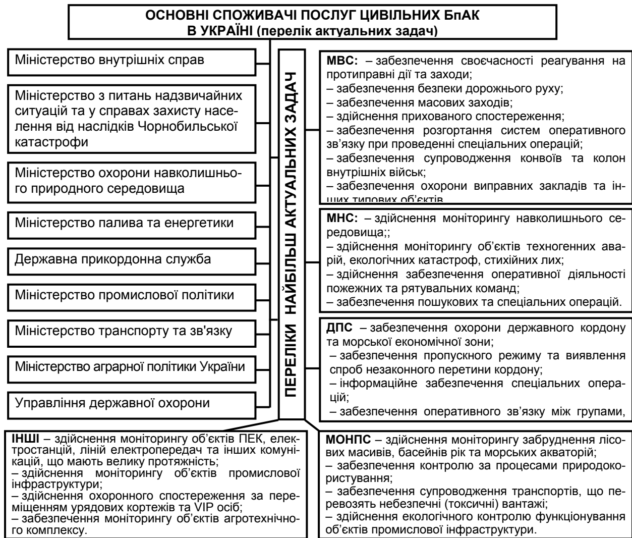
Рис. 1. Характеристика потреби у цивільних БпАК в Україні

Говорячи про показники економічності при застосуванні БпАК в цивільній сфері слід мати на увазі, що їх високий рівень може бути досягнуто завдяки розробці відповідних заходів одночасно по декільком напрямкам. Це переважно заходи, що спрямовані на забезпечення готовності оператора до застосування (рис. 2, а) та заходи із забезпечення конструктивної та експлуатаційної досконалості (рис. 2, б). При цьому вважається, що готовність оператора буде забезпечена, якщо будуть реалізовані заходи із забезпечення якісної підготовки операторів, заходи спрямовані на забезпечення відповідних характеристик робочих місць операторів (РМО), їх уніфікація для забезпечення можливості залучення операторів без суттєвої перепідготовки до управління БПЛА різного призначення, а також заходи спрямовані на забезпечення характеристик доступу оператора до управління БПЛА та його інформаційного забезпечення.