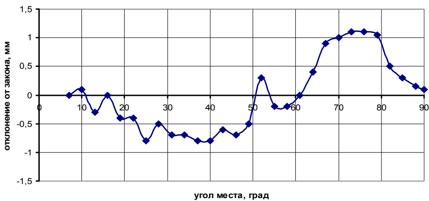
Рис. 2. Помилки відробітку закону руху КР по приводу корекції

Рух контррефлектора (КР) по приводу установки не викликає зсуву максимуму ДН, а величини помилок відробітку не перевищують 1,5 мм, що задовольняє вимогам технічних умов.