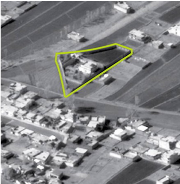
Рис. 4. Територія навколо особняка Усами бен Ладена (знімок з КА Ikonos, січень 2001 року)

Агентство геопросторової розвідки NGA забезпечило розробку детальних цифрових карт району з регулярним оновленням обстановки, оперативною географічною прив'язкою та відображенням потоків різномірної інформації з метою подальшого її аналізу, спостереження за станом об'єкту та створення тримірної моделі будівлі, на основі якої на військовій базі підготовки «морських котиків» була створена реальна будівля особняка для відпрацювання різних варіантів його штурму.