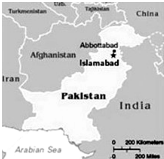
Рис. 1. Розташування пакистанського міста Абботабад

Повертаючись до операції «Geronimo», необхідно зазначити, що відомості про знаходження сховища Усами Бен Ладена в пакистанському місті Абботабад (50 км на північ від Ісламабада) (рис. 1) були отримані в серпні 2010 року в результаті допитів затриманих та спостереження за кур'єрами.