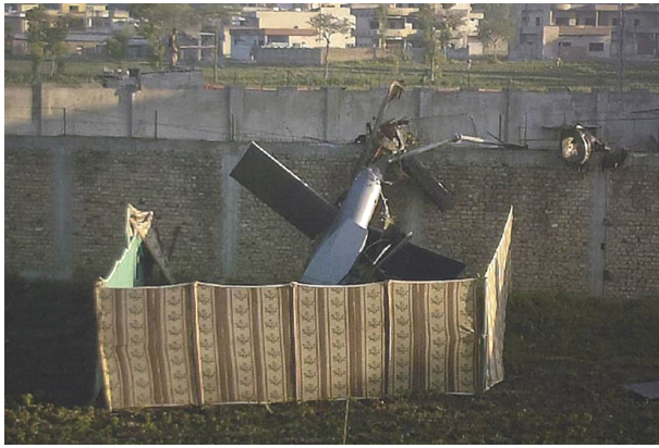
Рис. 6. Знищений бійцями американського спецназу гелікоптер Black Hawk

Як стало відомо фахівцям, в операції приймали участь секретні версії гелікоптера Black Hawk, який має низьку радіолокаційну помітність. Ця інформація стало також відомою завдяки супутниковим матеріалам. Екіпаж несправного гелікоптера та група спецназу, що знаходилась на цьому гелікоптері, було евакуйована двома транспортними гелікоптерами «Чінук», які забезпечували дозаправку гелікоптерів Black Hawk. Але ця версія залишає багато питань, наприклад, як важким транспортним гелікоптерам «Чінук», які не мають низької радіолокаційної помітності, не являються «невидимками» та не мають спроможності польоту на малих висотах з огинанням рельєфу місцевості, вдалося уникнути зони виявлення радарів протиповітряної оборони (ППО) Пакистану.