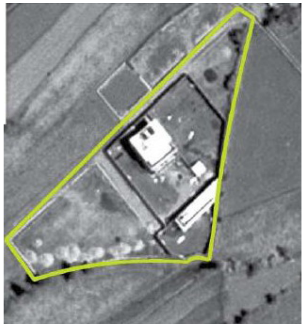
Рис. 3. Стан особняка Усами бен Ладена після побудови (знімок з КА Ikonos, 2005 рік)

За даними космічної геопросторової зйомки та з використанням методів фото- та стереофотограмметрії побудована тримірна модель особняка (рис. 5).