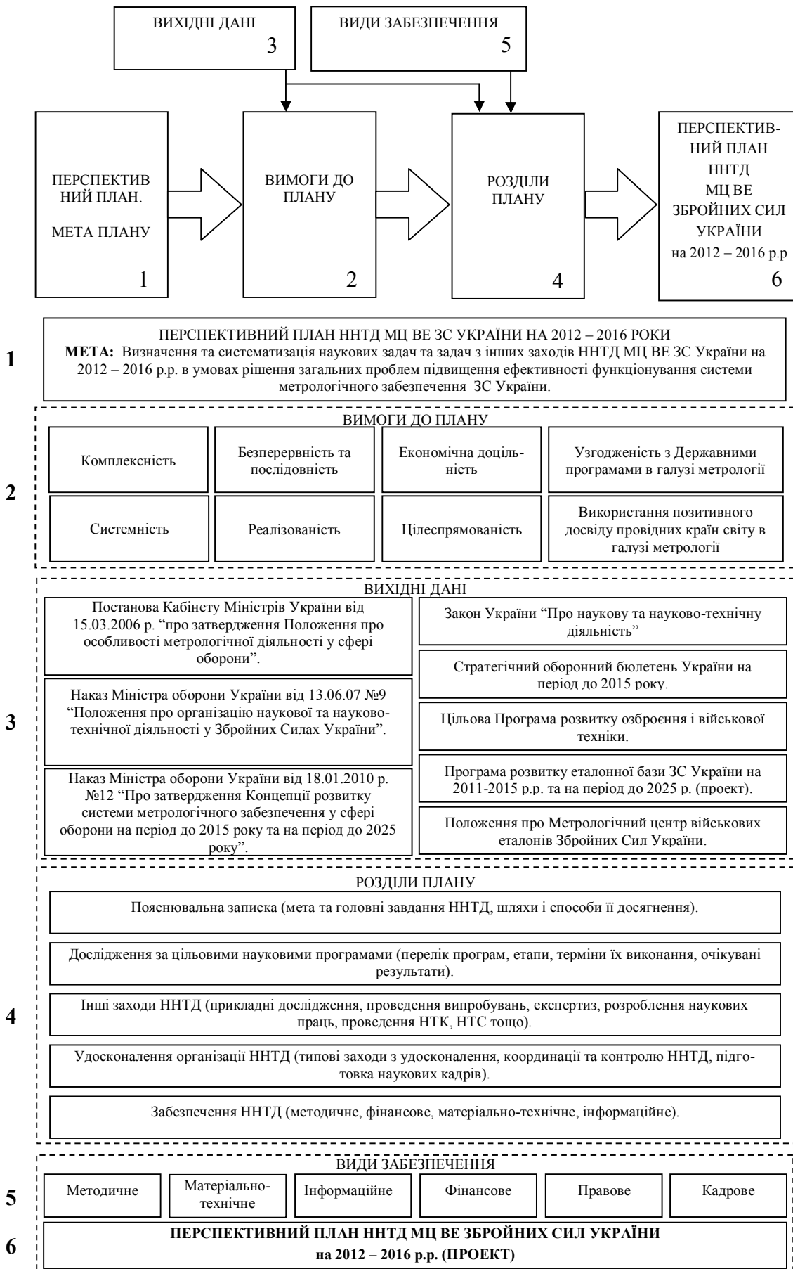
Рис. 3. Узагальнена логіко-структурна схема визначення науково-методичного апарату формування плану ННТД