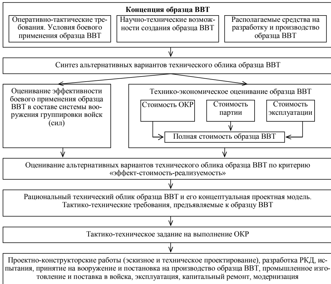
Рис. 1. Структурная схема методики формирования рационального технического облика планируемого к разработке образца ВВТ

(снабжение войск) и поставляться в войска для замены морально устаревших образцов ВВТ.