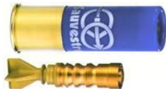
Рис. 3. Куля Sauvestre

3) куля Sauvestre [8] – спеціально розроблялась для БГЗ, силами спеціальних операцій Франції, окремі зразки кулі мають енергію на відстані до 100 метрів більшу чим у кулі патрону 7,62X39 зразку 1943 року для нарізної зброї (рис. 3).