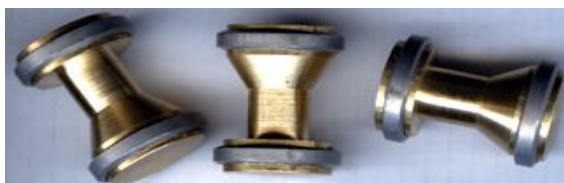
Рис. 1. Куля Блондо

1) куля Блондо на щорічних змаганнях у Франції на відстані 90 м зафіксований результат 5 влучень в коло 8 см, на відстані до 100 метрів енергія кулі близька до енергії кулі патрону 7,62X39 зразку 1943 року [5], (рис. 1);