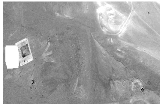
Рис. 2. Селективное изображение слабоконтрастного ИИ

Для снижения объектовой избыточности предлагается предварительное окрашивание ИИ гауссовским шумом с известными (заданными) параметрами. Тогда изображение для последующего фрактального анализа формируется как аддитивная смесь исходного изображения S_{ИИ} с высокой объектовой насыщенностью и матрицы гауссовского шума S_1 :