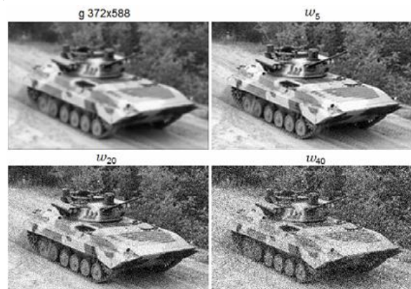
Рис. 2. Приклад обробки вихідного зображення в умовах розфокусування та змазування методом ітеративної регуляризації Фрідмана [10]

На рис. 2 наведено результати обробки вихідного зображення в умовах розфокусування та змазування з використанням методу ітеративної регуляризації Фрідмана при п'яти, двадцяти та сорока ітераціях.