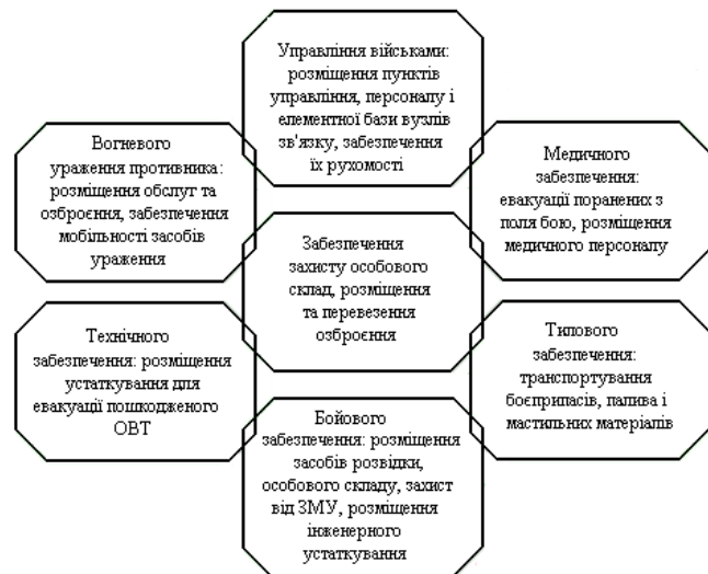
Рис. 1. Спектр бойового застосування колісних бойових броньованих машин

Аналіз особливостей використання БКМ у сучасних військових конфліктах, зокрема у зоні бойових дій під час проведення АТО показує, що вони можуть забезпечувати виконання широкого спектру бойових завдань (рис. 1).