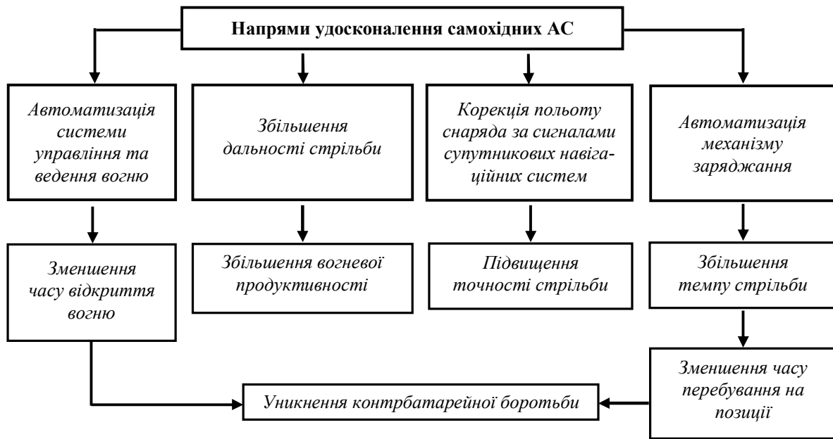
Рис. 2. Напрями удосконалення самохідних артилерійських систем

Навіть російські та китайські виробники пропонують АС, які розроблені під цей стандарт.