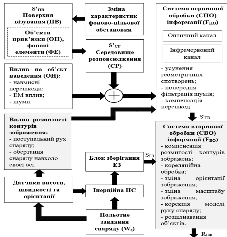
Рис. 2. Структурна схема КЕСН

1. Визначити необхідні умови для забезпечення тактико-технічних характеристик реактивної системи залпового вогню (РСЗВ) щодо точкового ураження ними наземних цілей в умовах розвиненої інфраструктури населених пунктів. Обґрунтувати вимоги до точності наведення снарядів РСЗВ на наземні цілі противника.