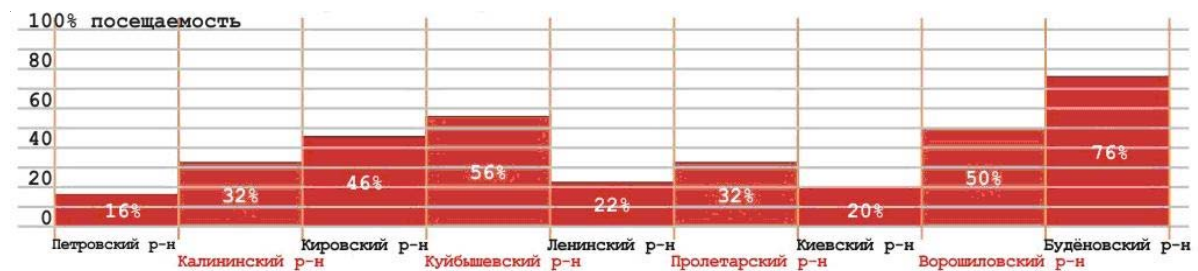
Рисунок 3. Посещаемость зрителями учреждений культуры и досуга по административным районам г. Донецка.