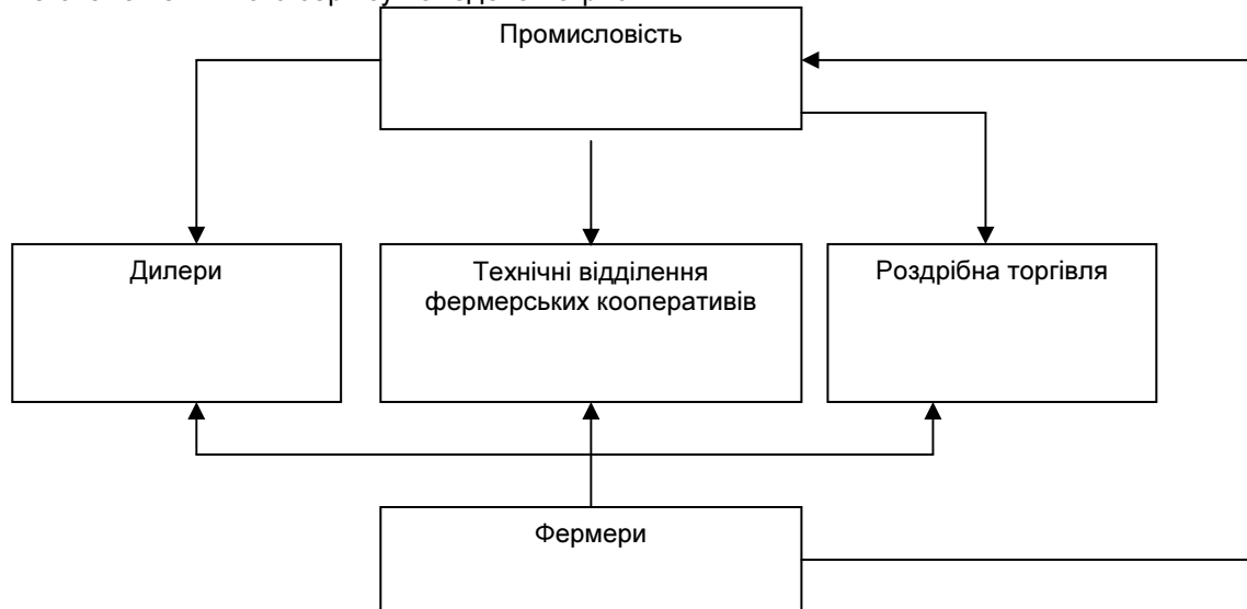
Рис. 1. Схема технічного сервісу

Загальна схема технічного сервісу наведена на рис. 1.