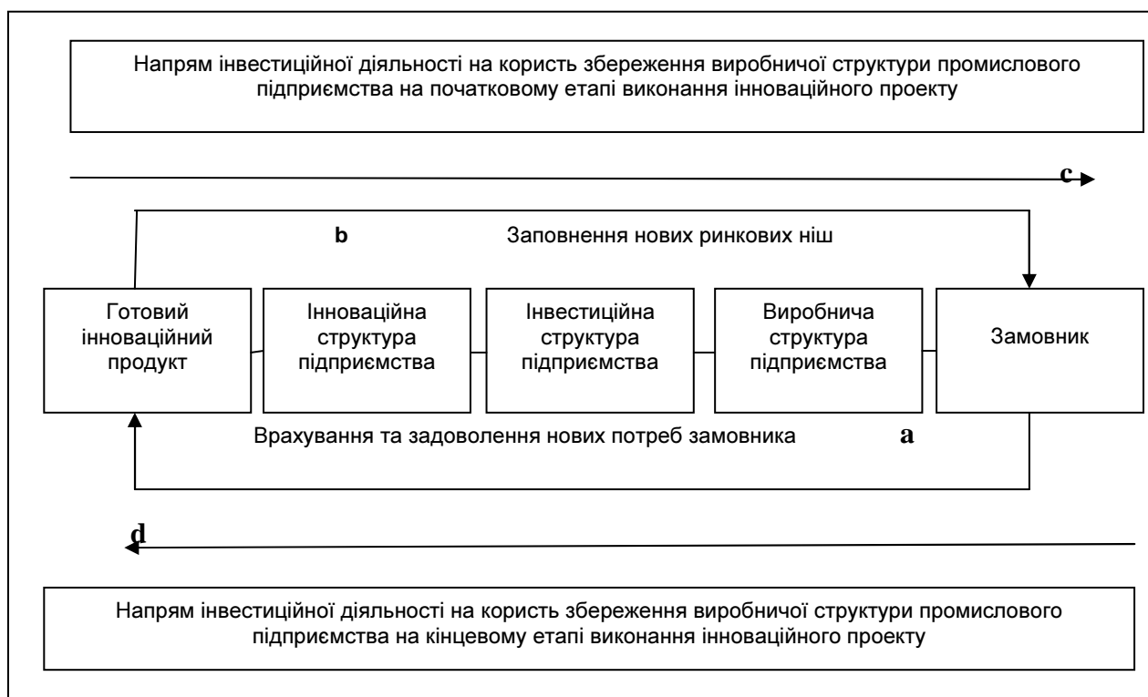
Рис. 1. Напрями інвестиційної діяльності в режимі «crash-management»

управління інноваційно-інвестиційною діяльністю промислових корпорацій необхідно розглянути їх інноваційну, інвестиційну і виробничу структури (рис. 1). Інноваційна структура є інноваційним підприємством з оточенням його зовнішніми венчурними компаніями та інноваційною інфраструктурою у вигляді основних фондів, що забезпечують інноваційну і господарську діяльність, що призводить до випуску готового інноваційного продукту [4].