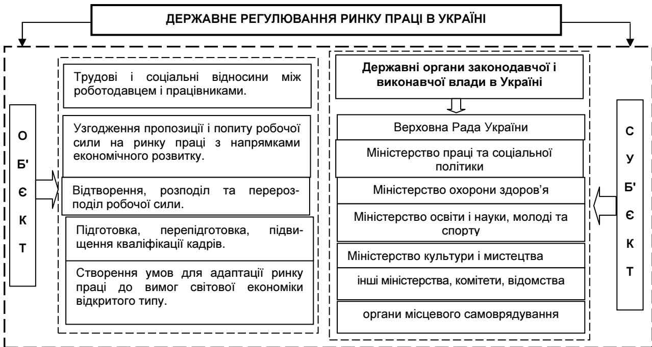
Рис. 1. Система суб'єктів та об'єктів державного регулювання ринку праці

Важливе значення для дослідження державного регулювання ринку праці має обґрунтування суб'єкта і об'єкта регулювання. Згідно з теорією управління, до суб'єктів управління відносяться державні установи, організації та посадові особи, які формують державну політику відповідно до делегованих їм повноважень, а об'єктами є процеси і умови функціонування та відтворення робочої сили, зайнятості населення. Схематично суб'єкти та об'єкти державного регулювання ринку праці і соціальної політики в Україні наведено на рис. 1.