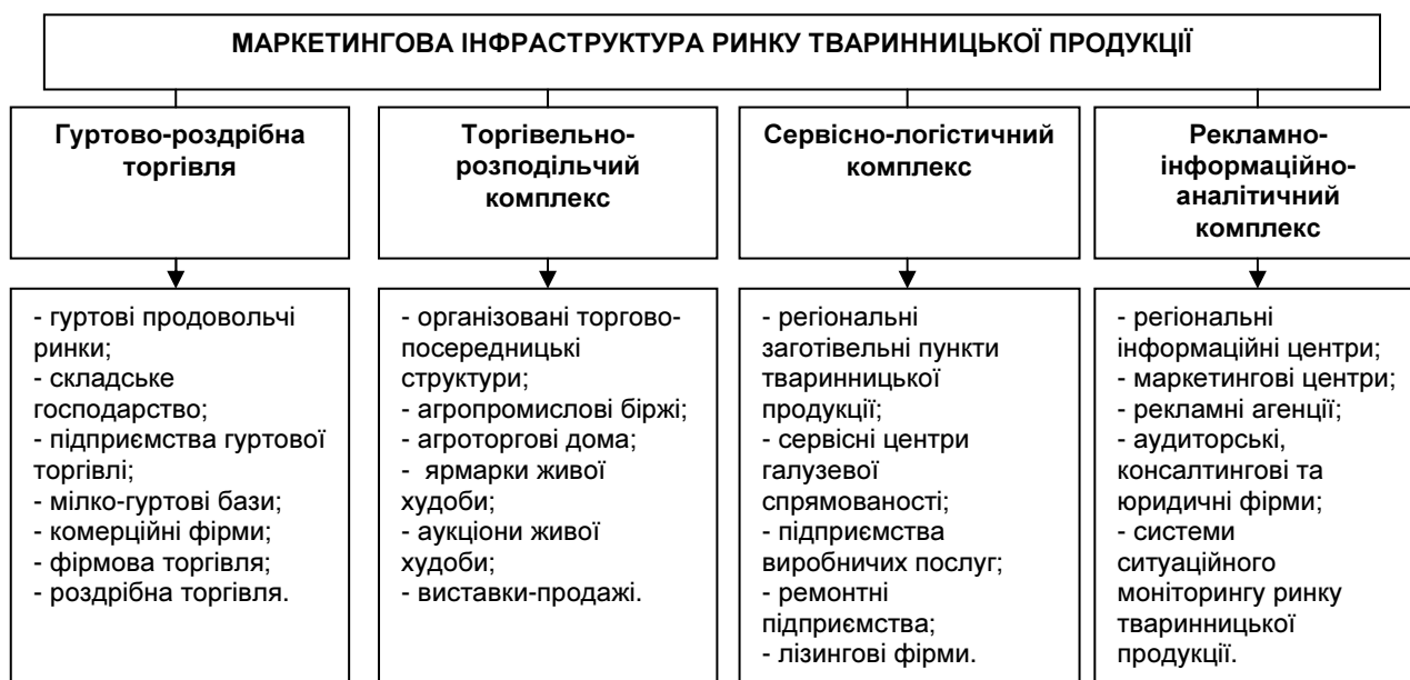
Рис. 2. Структура маркетингової інфраструктури ринку тваринництва

Вкрай необхідною основою дієвої системи функціонування ринку тваринницької продукції є об'єднання маркетингової, фінансово-кредитної, виробничої, науково-інноваційної інфраструктури та інфраструктури галузевого ринку праці. Проте зосередимо увагу на складових саме маркетингової інфраструктури ринку тваринницької продукції. Доцільним є конкретизація елементів маркетингової інфраструктури (рис. 2).