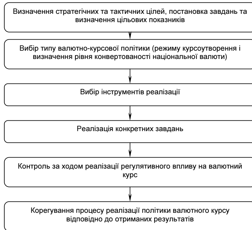
Рис. 2. Процес формування і реалізації валютно-курсової політики