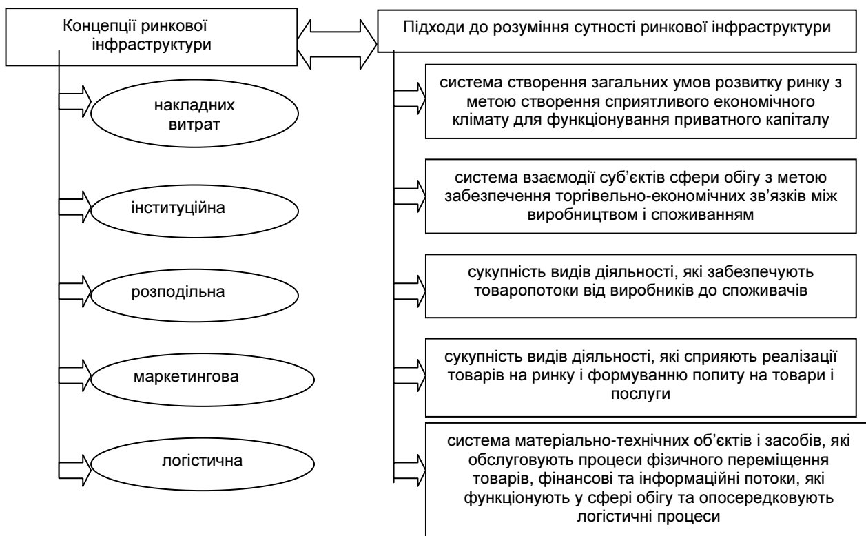
Рис. 1. Характеристика наукових підходів до розуміння сутності ринкової інфраструктури

Концепція накладних витрат є домінуючою у більшості досліджень питань формування та розвитку ефективної ринкової інфраструктури. Найбільшого розвитку ця концепція одержала у працях В.Н. Стаханова, Л.Н. Добришиної, Т.Г. Зотової, С.С. Голубевої та ін. Ключовим постулатом концепції є: ринкова інфраструктура – це основа функціонування ефективної ринкової економіки, головною функцією якої є створення сприятливого клімату для функціонування приватного капіталу. Причому, в поле зору прихильників і послідовників цієї концепції потрапляють організаційно-економічні аспекти розвитку інфраструктури, а фінансові аспекти залишаються поза їх увагою.