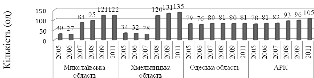
Рис. 3. Готелі та інші місця для тимчасового проживання у зоні кластеризації «Південне туристичне кільце», за 2005-2011 рр., од

Кращим є становище з розвитком готелів та інших місць для тимчасового проживання туристів (рис. 3). Так, у Миколаївській області збільшується кількість готелів та інших місць розміщення туристів на 92 одиниці, при цьому щорічні темпи зростання склали в: 2006/2007 рр. – 211,1%; у 2007/2008 рр. – 13,1%; у 2008/2009 рр. – 24,4%; у 2009-2011 рр. – 122 %. Однак, у зазначений період наявне зростання кількості номерів (на 697 од.) за відносно невеликого зростання їх житлової площі (13 тис. м 2 ), що свідчить про низький рівень комфортності. Аналогічна позитивна динаміка за 2005-2011 рр. спостерігається у Хмельницькій області, де збільшення склало 101 одиниць та АРК зі збільшенням на 26 одиниць.