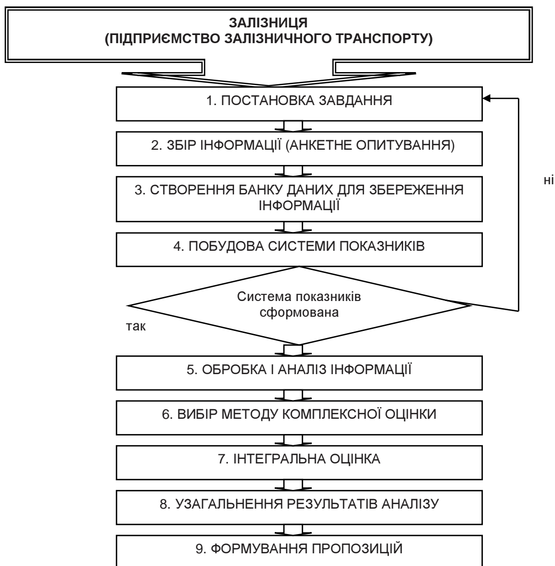
Рис. 2. Алгоритм проведення моніторингу соціальної захищеності працівників залізничного транспорту України

Алгоритм проведення моніторингу соціальної захищеності працівників залізничного транспорту передбачає низку послідовних етапів (рис. 2).