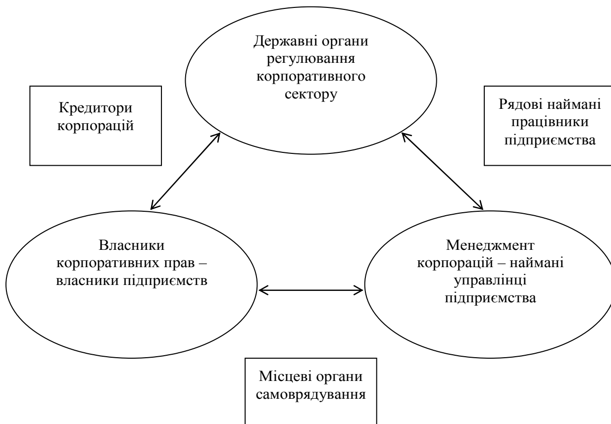
Рис. 2. Схема взаємодії суб'єктів корпоративного управління