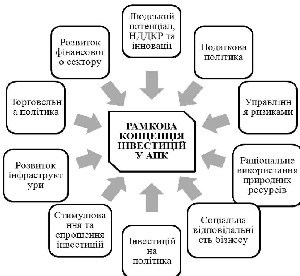
Рис. 1. Базові елементи Рамкової концепції інвестицій в АПК