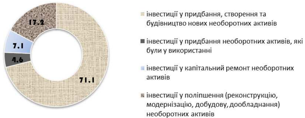
Рис. 1. Структура капітальних інвестицій в Україні за формами відтворення за 2014 р., %

вага яких склала понад 96%. Найбільшу частку серед них зайняли: машини, обладнання та інвентар – 32%, інженерні споруди – 23%, нежитлові будівлі – 17% та житлові будівлі – 16% (рис. 2).