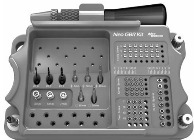
Рис. 2. Набор для направленной костной регенерации GBR.

Коническое соединение имплантата и абатмента, переключение платформ (Platform Switching), форма апекса для немедленной установки имплантата, коронарная макрорезьба и экстрачистая поверхность дают нашему имплантату те преимущества, которых нет у конкурентов. Именно ряд значимых характеристик совмещенных в имплантатах IS-II и IS-II Active, так понравился имплантологам из США, Англии, Германии, Италии и других стран-лидеров в этой отрасли.