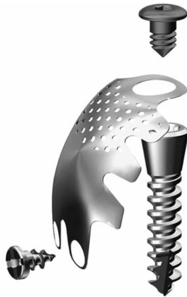
Рис. 3. Система фиксации титановых мембран при помощи набора GBR.

У нас появилось много новинок, которые мы с радостью представим в 2014 году в Украине. Поэтому я приглашаю всех стоматологов на образовательные мероприятия, которые проводит наш партнер в Украине. Там можно будет увидеть и попробовать своими руками те новшества, которыми гордится компания. В планах сотрудничество с Украинской медицинской стоматологической академией и другими университетами Украины. Также я приглашаю всех наших друзей посетить симпозиум Neobiotech-2014 в Сеуле.