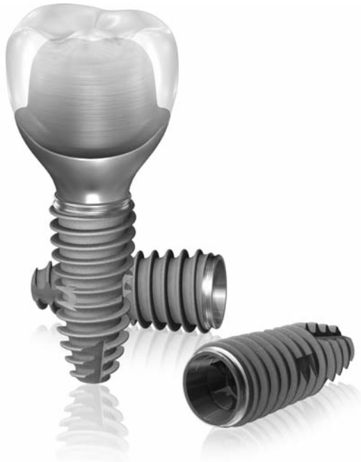
Рис. 1. Имплантат IS-II Active.