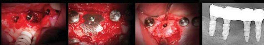
Материал для направленной костной регенерации: Аутогенная кость благодаря АСМ и Мембрана СТИ-мет