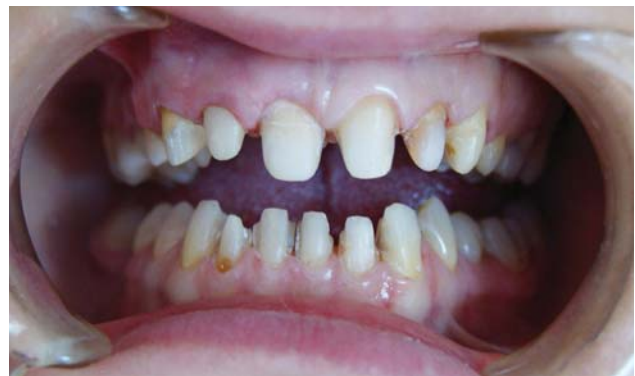
Рис. 4. Вигляд після препарування та відновлення культі.