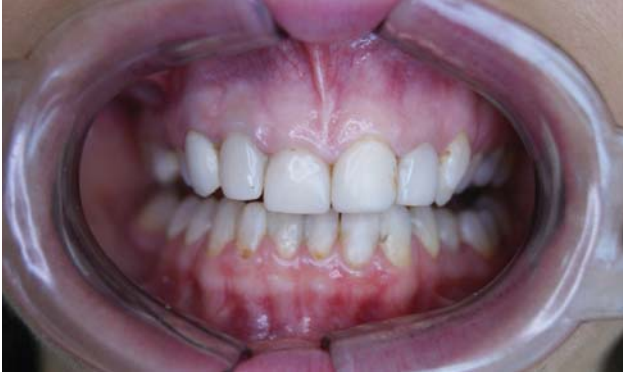
Рис. 1. Вигляд вихідної клінічної ситуації.