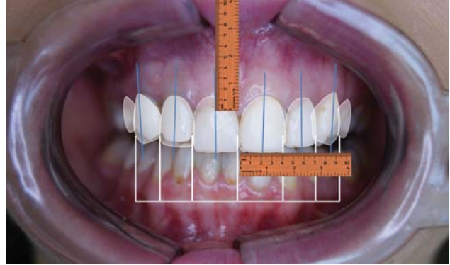
Рис. 2. Планування майбутніх маніпуляцій з використанням принципів Digital Smile Design.

контурування дефекту та його візуалізації пацієнту. Аналіз естетичних параметрів посмішки проводився згідно з рекомендаціями Е. McLaren, L. Culp (2013) [32–34] відповідно до симетричності та горизонтальності ясенного краю, відносної прямолінійності ясенного краю різців і незначного інцизального шифту краю в ділянці бокових різців, симетричності позиції ясеневих сосочків (з середніми показниками висоти 4–5 мм у фронтальній ділянці). На основі проведеного аналізу елементів рожевої естетики було заплановано процедуру лазерну корекції ясенного краю з подовженням висоти клінічної коронки та формуванням адекватного ясенного контуру з відповідним позиціонуванням відповідних естетичних зонітів (рис. 3).