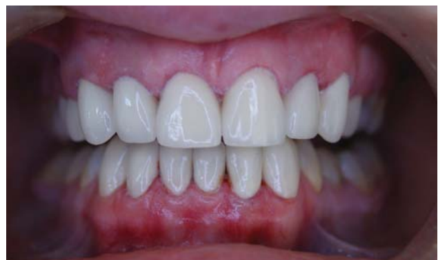
Рис. 5. Остаточний вигляд реставрацій після фіксації.