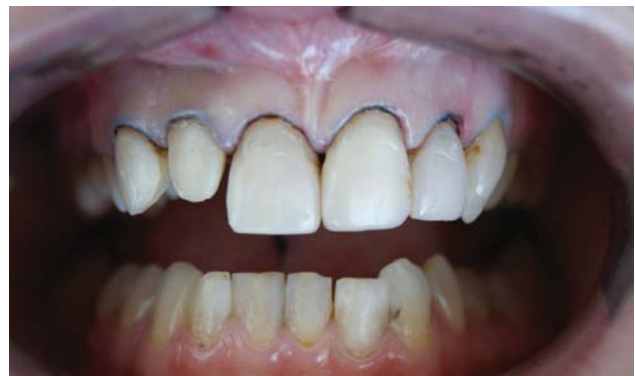
Рис. 3. Вигляд після зняття попередніх реставрацій і корекції ясенного краю.

Для відновлення адекватних параметрів культі зубів 1.2 і 1.3 вони були армовані скловолоконними штифтами «RelyX™ Fiber Post» (3М™). Глущенко М.А. (2006) [46] установив, що при використанні штифтових конструкцій для армування культі уражених зубів найбільш поширеними ускладненнями подібного алгоритму лікування є: порушення фіксації штифтової конструкції (24,51 %), перелом реставраційного матеріалу (14,71 %), перфорація ділянки фуркації коренів або безпосередньо стінки кореня (16,67 %), порушення фіксації кінцевої реставрації (17,65 %). І хоча вчений математично та клінічно обґрунтував доцільність використання перфорованого анкерного штифта з метою реставрації