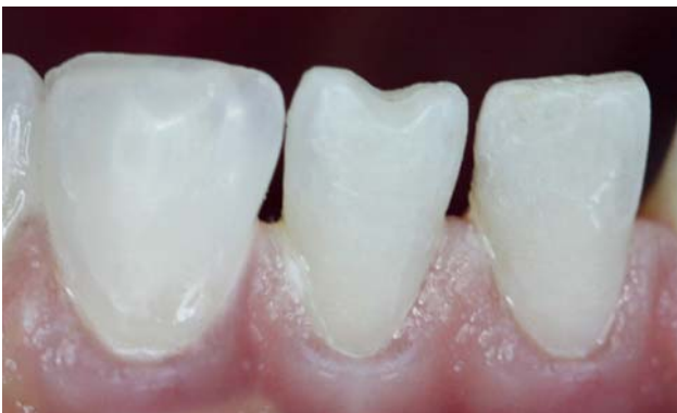
Рис. 19. Завершающий этап реставрации выполнен оттенком В0,5-Е (вид справа).