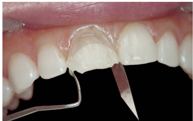
Рис. 12. Фиксация лавсановой матрицы при помощи жидкотекучего фотополимера «Jen LC-Flow» (A1) с одновременным закрытием тремы и диастемы.