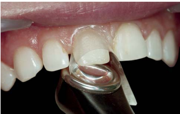
Рис. 11. Полимеризация адгезива фотополимерной лампой «Valo».