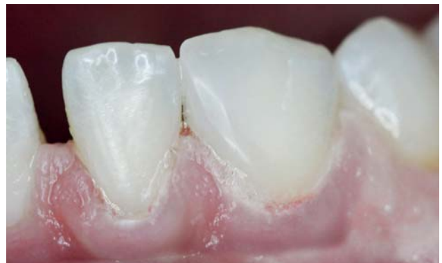
Рис. 20. Восстановление медиально-апроксимальной стенки с помощью композита «Jen-Padiance В0,5-Е» (вид слева).