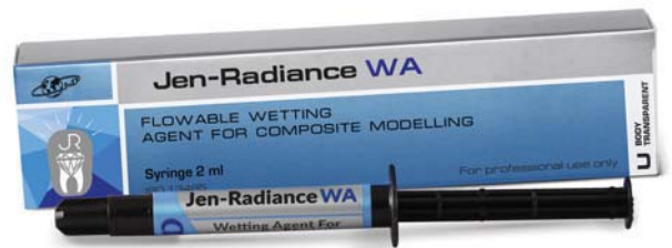
Рис. 6. Jen-Radiance Wetting Agent – светоотверждаемый суперадаптивный композитный увлажняющий материал.

белый). Затем нужно использовать регулярные опакowe, эмалевые и транспарентные оттенки, воспроизводя прозрачные эмалевые слои зуба и создавая под ними хроматические пальцеобразные зоны дентина (имитирующие мамелоны). Правильный подбор опакowych и прозрачных оттенков позволяет успешно строить оптическую модель зуба в зависимости от возрастных особенностей пациентов и характеристических особенностей их зубов. В гамму оттенков материала «Jen-Radiance» входят также суперопаки стандартных цветов по расцветке Vita: А1-СО, А2-СО, А3-СО, В2-СО и некоторые другие. Эти материалы с успехом применяются там, где необходимо перекрыть собственную дисколорированную, но здоровую зубную ткань слоем композита минимальной толщины (1–1,5 мм), так чтобы потеря собственной зубной ткани была минимальной или же ее не было вообще. В сочетании с тонкими слоями регулярных опакowych и дентинных материалов эти оттенки отлично зарекомендовали себя при реставрации зубов фронтального ряда прямыми композитными винирами [1].