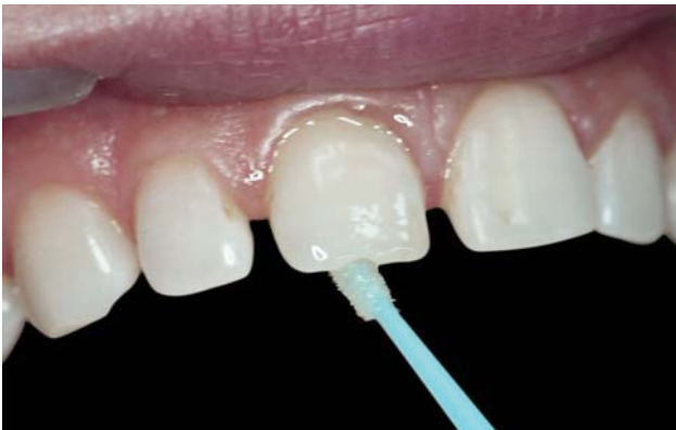
Рис. 9. Апликация адгезива «Jen-Unibond» с помощью браша. Активное втирание в ткани зуба.