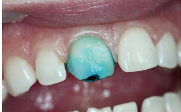
Рис. 8. Для кондиционирования поверхности на зуб наносится 37 % ортофосфорная кислота Phospho-Jen AS.

Обычно, ткани зуба убирают в том количестве, которое необходимо для создания рабочей поверхности, достаточной для обеспечения прочности будущей реставрации. В данном случае использовался минимально инвазивный подход, направленный на максимально возможное сохранение живых тканей зубов.