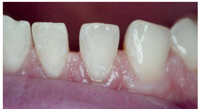
Рис. 18. Предварительное препарирование 31, 32, 33, 41 и 42-го зубов (вид слева).