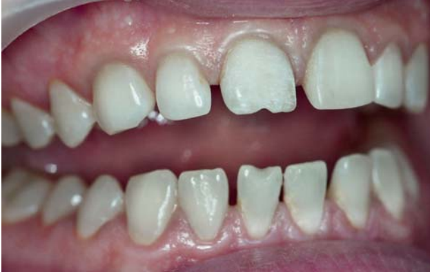
Рис. 7. Минимально инвазивное препарирование 21-го зуба.

слишком тонкий слой эмалевого оттенка, наложенный на суперопаковый слой, может придать реставрации «неживой» вид, а слишком толстый слой прозрачной эмали, наложенный на регулярный опаковый оттенок, может увести тон цвета реставрации в серую область. В представленном клиническом случае реставрация осуществлялась методом послойного нанесения композитного материала.