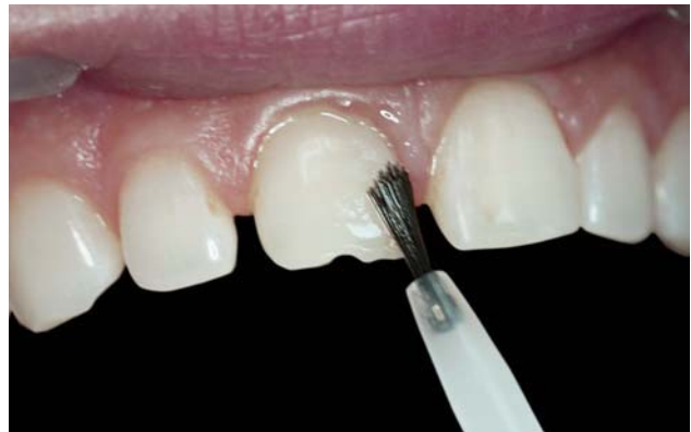
Рис. 10. Распределение адгезива с помощью кисточки.