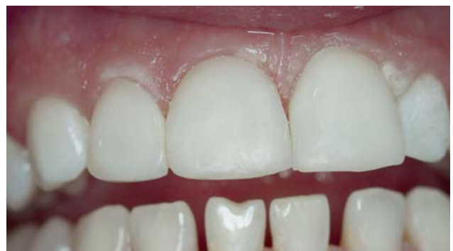
Рис. 16. Реставрация 11, 12, 21-го зубов.