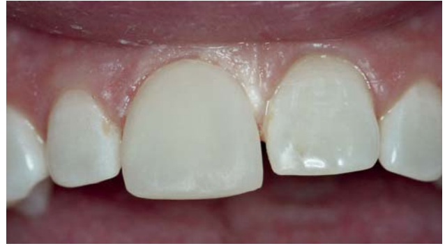
Рис. 14. Вид отмоделированного зуба на фоне остальных зубов.