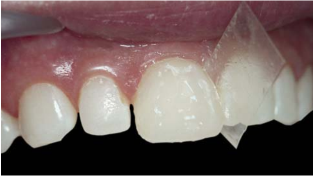
Рис. 13. Нанесение композита «Jen-Padiance» (В0,5-О) и (В0,5-Е) на вестибулярную поверхность и моделирование анатомических структур.