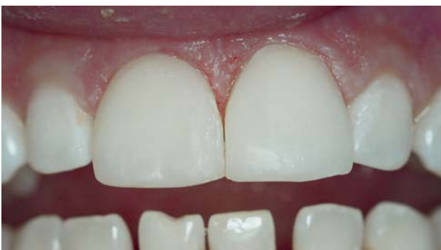
Рис. 15. Реставрация 11 и 21-го зубов без финишной полировки.