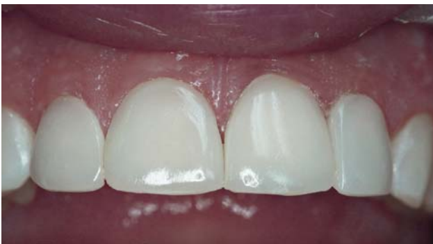
Рис. 17. Финишная полировка четырех верхних центральных резцов.