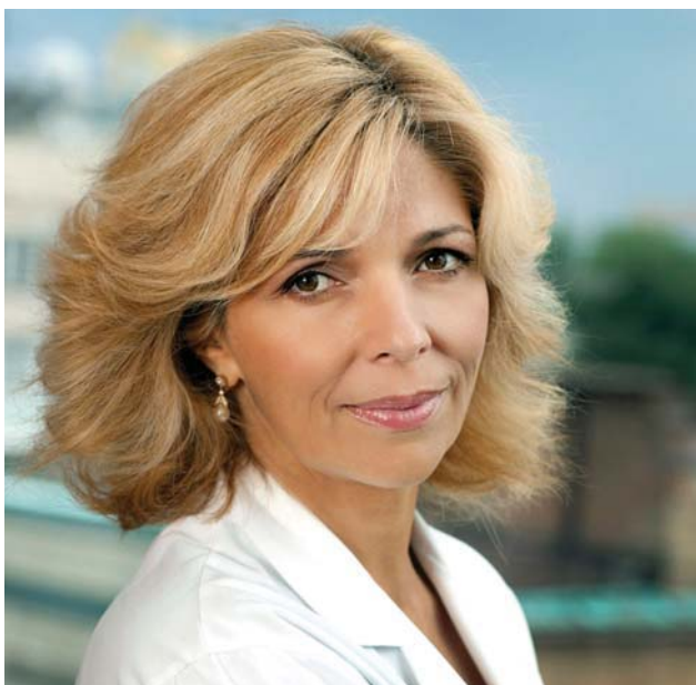
Ольга Вадимівна Богомолець

Народний депутат України, заступник голови Комітету Верховної Ради України з питань охорони здоров'я Ірина Володимирівна СИСОЄНКО зазначила, що неможливо переоцінити важливість реформування саме цього напрямку медицини в нашій країні, адже кількість звернень громадян по стоматологічній послугі посідає друге місце серед загальної кількості звернень по медичну допомогу. Народний депутат доповіла, що 19 жовтня ВР України ухвалила Закон № 6327 «Про державні фінансові гарантії надання медичних послуг і лікарських засобів», наголосила, що саме з його прийняттям медична спільнота повинна розпочати впровадження європейських стандартів у галузі охорони здоров'я, і зауважила, що це лише перший крок у розвитку й реформуванні медичної галузі. «Протягом наступних трьох років Україна буде поступово переходити до нових умов надання медичної допомоги у клінічних центрах, – сказала Ірина Володимирівна. – Саме тому вкрай важливо на законодавчому рівні визначити організаційно-правову роль лікарів-стоматологів, удосконалити рівень їх юридичного захисту. Зміни, що відбуваються сьогодні, спрямовані насамперед на створення належних умов для професійної діяльності медичних працівників, адже тільки за таких обставин українські пацієнти зможуть отримувати якісну медичну допомогу.