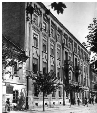
Рис. 4. Будинок клініки стоматології львівського університету на вул. Оссолінських, тепер – В. Стефаніка (вигляд на час відкриття поліклініки).

З наукових праць відомі такі: «Про знечуження шкіри кокаїном під впливом електричного струму» (часопис «Лікарський огляд», 1899); «Про кон'югаційну теорію Монгерштерна» (часопис «Лікарський огляд», 1900); «Про виділення і склад слини привушної залози під впливом різних чинників» (часопис «Лікарський огляд», 1900); «Про утворення кіст слизової оболонки ясен» (часопис «Польський архів біологічних і медичних наук», т. 1, 1901); «Про так звані силікатні пломби» (часопис «Огляд дентистичний», Варшава, 1904); «Гіперемія пульпи в клінічному розумінні» (часопис «Львівський лікарський тижневик», 1906); «Про роль фосфору в організації субстанцій кістки і зуба» («Пам'ятка X з'їзду лікарів і природників Польщі», 1907); «Який метод лікування некрозу пульпи і кореневих каналів дає найкращі результати?» (часопис «Львівський лікарський тижневик», 1907); «До питання патогенезу альвеолярної піореї» (часопис «Львівський лікарський тижневик», 1907); «Про пломби з порцелянових цементів» (часопис «Львівський лікарський тижневик», 1907); «Про кремнієві пломби» (часопис «Хроніка дентистична», Варшава, 1908), «Цікавий випадок протоки