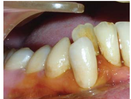
Рис. 1 д. Через п'ять днів після лікування (ділянка 43, 44 зубів). Від'ємна проба Шиллера-Писарева.