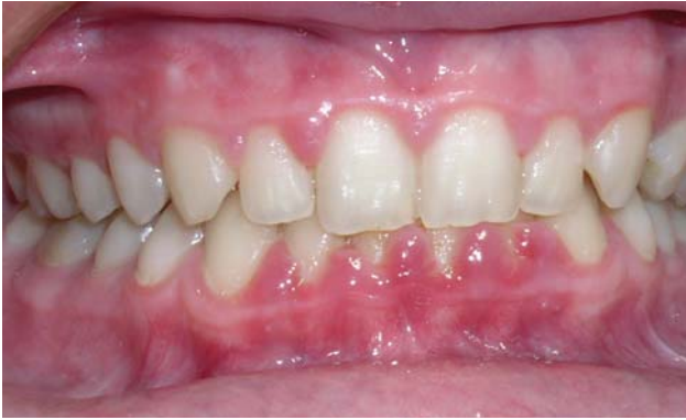
Рис. 2 а. Хв. Б., 18 років (основна група). Глибокий прикус.