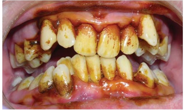
Рис. 1 б. Позитивна проба Шиллера-Писарева.