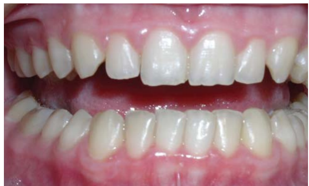
Рис. 2 г. Через 10 днів після лікування. Відсутність запальних явищ, нормалізація стану тканин ясен.

Аналіз динаміки індексів гігієни порожнини рота у хворих основної групи, які пройшли курс лікування препаратом «Тантум Верде®», через місяць демонстрував найкращі значення: ОНІ-S – 0,8 \pm 0,12 бала, що достовірно відрізнялись від показників гігієни у групі порівняння – 1,9 \pm 0,30 відповідно ( p < 0,05 ). Індеси РМА та кровоточивості Mühlemann H.R. через місяць після лікування у хворих основної групи склали 10,05 \pm 0,10\% та 0,2 \pm 0,1 бала відповідно (рис. 2 а, б, в, г). Дані показники відрізнялись від значень у групі порівняння, де індекс РМА через місяць становив 22,29 \pm 1,21\% ; індекс Mühlemann H.R. – 1,16 \pm 0,26 ( p < 0,05 ), що свідчило про недостатньо позитивний рівень отриманих результатів. Упродовж усього періоду лікування з використанням пре-