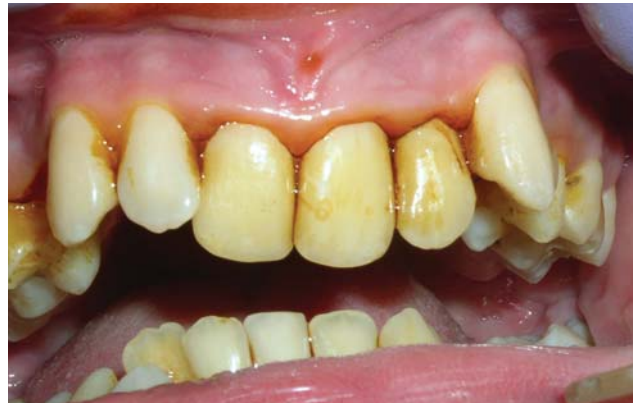
Рис. 1 є. Через п'ять днів після лікування. Від'ємна проба Шиллера-Писарева.

2,42±0,22 бала, у той час як у групі порівняння ці значення в середньому склали 2,36±0,21 бала. Отримані показники повною мірою відповідали незадовільній індивідуальній гігієні порожнини рота. Об'єктивно реєстрували ознаки запального процесу: набряк ясен, гіперемію із ціанотичним відтінком, кровоточивість, біль при пальпації. Позитивна проба Шиллера-Писарева теж підтверджувала наявність запального процесу. Індекси РМА та кровоточивості Mühlemann H.R. до лікування у хворих основної групи становили 45,42±2,19 % та 1,38±0,18 бала, а у групі порівняння – 49,29±1,91 % та 1,26±0,26 бала, що відповідало перебігу запального процесу середньої важкості.