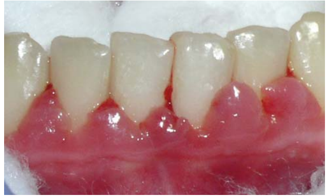
Рис. 2 б. Гіпертрофічний гінгівіт в ділянці фронтальних зубів нижньої щелепи.