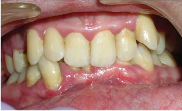
Рис. 1 а. Хв. Ш., 24 роки (основна група). Глибокий прикус, вестибулярне положення ікол, скупченість зубів. Хронічний катаральний гінгівіт до лікування.