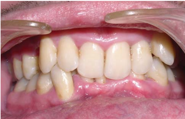
Рис. 1 е. Через п'ять днів після лікування, зменшення запальних явищ тканин ясен.