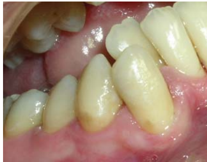
Рис. 1 г. Через п'ять днів після лікування (ділянка 43, 44 зубів) до проведення проби Шиллера-Писарева.