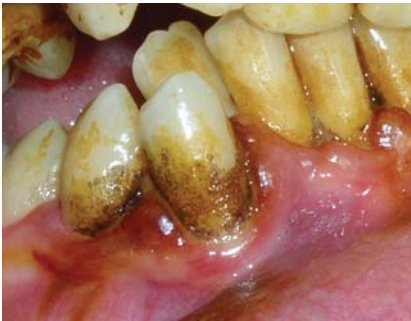
Рис. 1 в. Рясне відкладання назубного нальоту (ділянка 43, 44 зубів) до лікування.