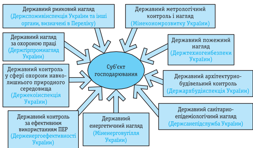
Рис. 3. Сьогодення система державного нагляду (контролю) за суб'єктами господарювання у сфері промисловості (крім харчової) та будівництва

З 09.12.2010 Указом Президента України [11] розпочалося реформування ЦОВВ згідно з концепцією, затвердженою у Законі [12]. Викладемо її стисло. Систему ЦОВВ складають міністерства України (далі — міністерства) та інші ЦОВВ: служби, інспекції, агентства (рис. 2). На відміну від урядових органів, які діяли до адміністративної реформи у складі ЦОВВ, служби, інспекції та агентства — це самостійні ЦОВВ, діяль-