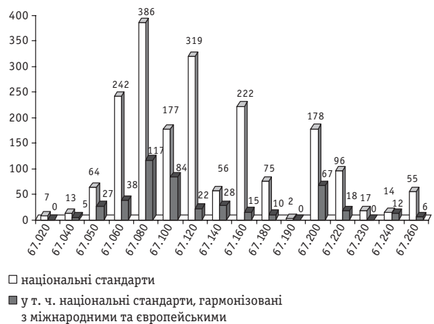
Рис. 2. Кількість чинних національних стандартів агропромислового комплексу за кодами ДК 004